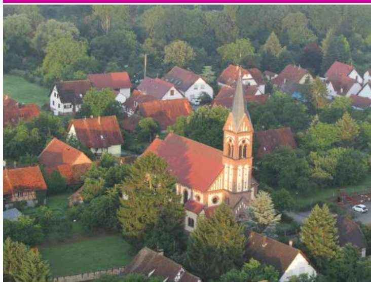
L'église catholique Saint-Georges consacrée en 1904