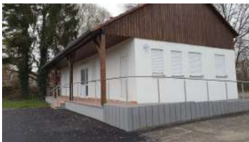
Le club house a été repeint