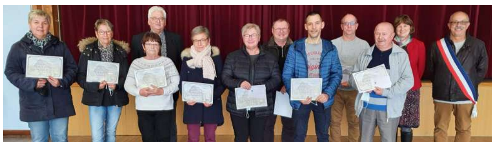
Les lauréats du fleurissement des maisons en 2021.