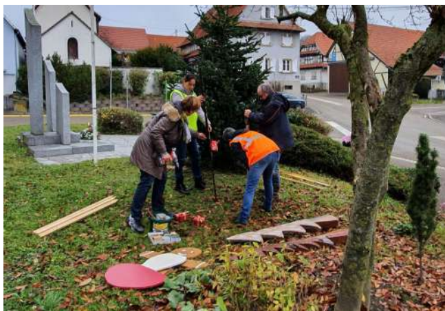
La mise en place des décorations de Noël devant la mairie-école

d'arbres le long de la piste cyclable et mise en place des sapins et des décorations de Noël. On a surtout ramassé des mégots, des canettes en aluminium et en verre, des masques chirurgicaux, des sachets en plastique, du papier, du polystyrène, des couches de bébés, etc. Dans le cadre de la « Trame verte », 24 arbres ont été plantés : des érables, des charmes, des tilleuls, des sorbiers des oiseleurs et des pins sylvestres. (Les six arbres restants ont été plantés par les écoliers le mardi 23 novembre).