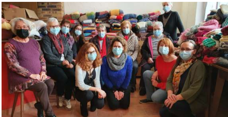
Tricot solidaire : Samedi 27 novembre, 2000 pièces tricotées ont été présentées à l'espace AMOF avant d'être remises aux associations destinataires.