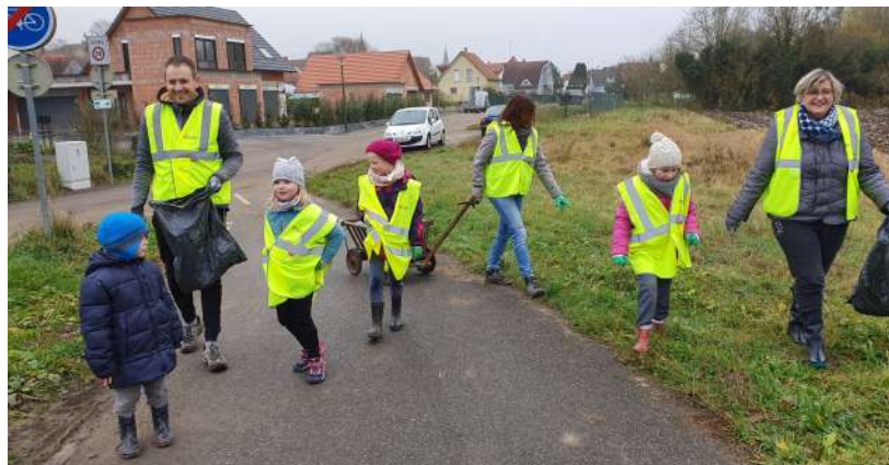
Les petits ont également participé au nettoyage de la commune

« Trame verte »: plantations d'arbres le 20 novembre