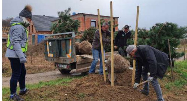
Plantations d'arbres par les écoliers le 23 novembre

« Trame verte »: plantations d'arbres le 20 novembre