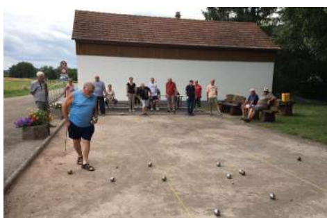
Une partie de pétanque