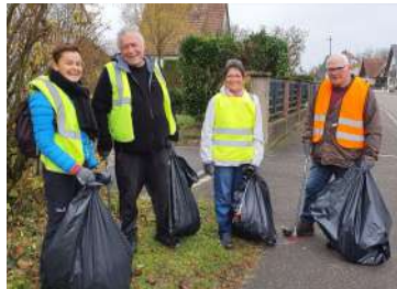
Le nettoyage du ban de la commune