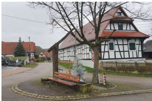
La place de la rue de la Forêt sera réaménagée.

Au vu de contrainte de circulations, étroitesse des voies, analyse du site et besoin de sécurisation nous proposons d'étudier les rues de la forêt et des mineurs sous le même régime de circulation : voie partagée – zone 20km heures. sur ces deux voies les modes doux seront prioritaires. voie partagée – zone 20km heures : évite de séparer les modes doux de la voie qui a pour effet d'augmenter la vitesse des VL qui ne doivent pas partager la voie. La commune met en place une trame verte et est attentive à la place de l'arbre dans l'espace public, Le tilleul situé à côté du puits rue de la Forêt sera remplacé.