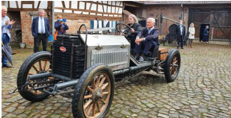
La Bugatti 35 B, prototype des voitures de course construites de 1924 à 1930 a été exposée à la Maison rurale.