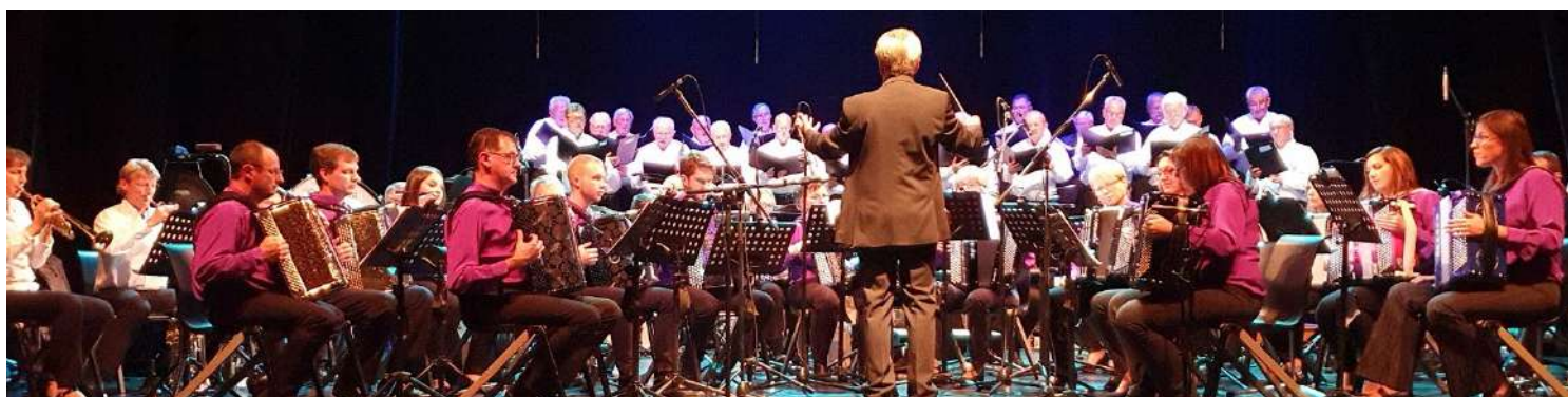
Septembre: Concert de gala du 40 e anniversaire avec le chœur d'hommes de Sultz-sous-Forêts à la Castine de Reichshoffen