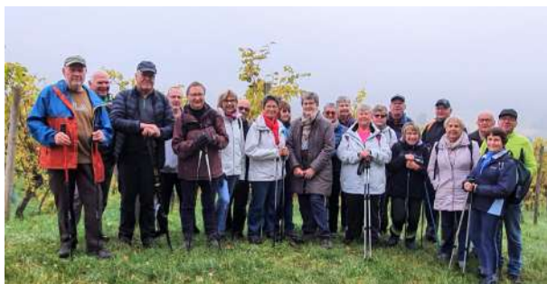
Sortie pédestre dans le vignoble de Cleebourg