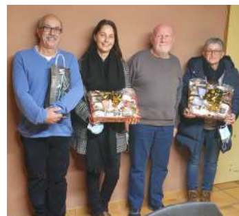
Les couturières qui ont réalisé des masques ont été remerciées lors de l'AG de l'ALK