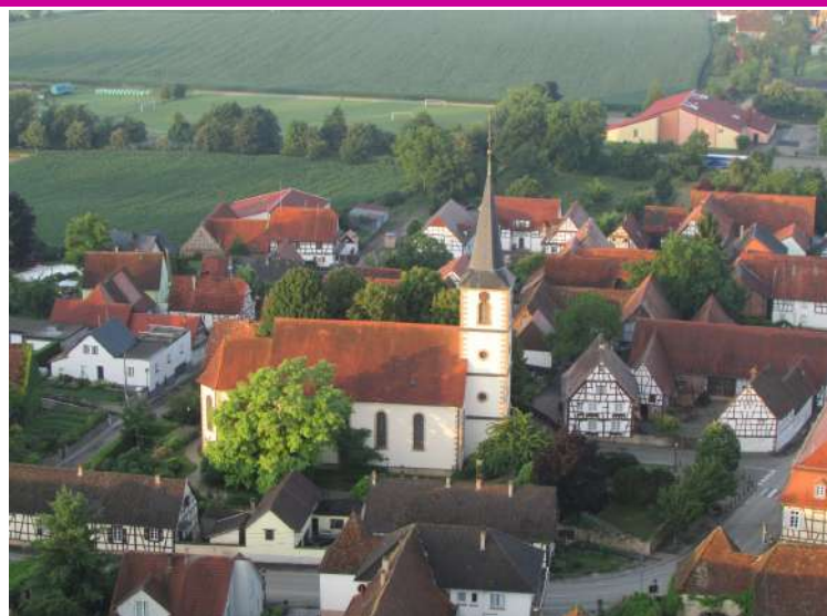
L'église protestante, ancienne église simultanée