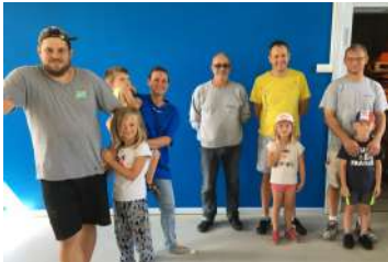
Ils ont aidé à repeindre la salle de classe de l'école maternelle