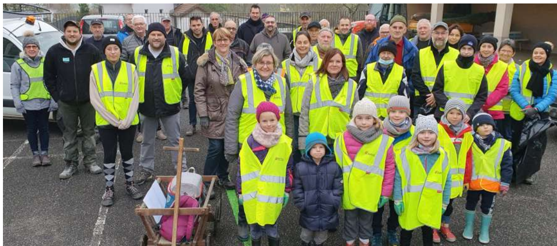
45 participants étaient présents dans la cour de l'école ce samedi matin

Samedi 20 novembre , la population était invitée par la municipalité à une action citoyenne et écologique : ramassage des déchets, mise en place des décorations de Noël et plantation d'arbres le long de la piste cyclable dans le cadre d'une opération