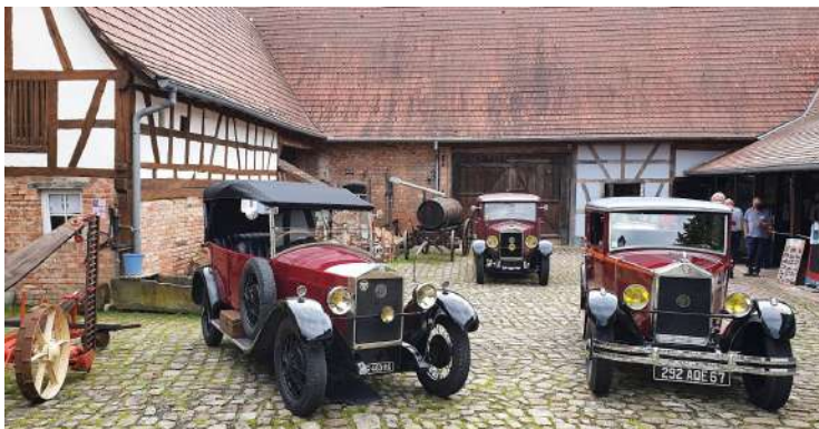
Juillet: Trois voitures Mathis ont été présentées dans la cour de la Maison rurale dans le cadre d'une journée consacrée à Emile Mathis.