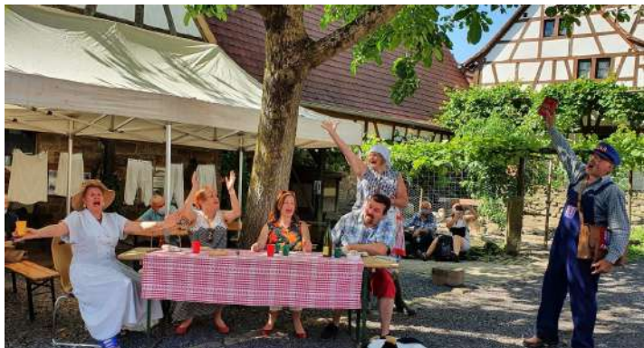
Juillet , dans le cadre de l'exposition estivale « Vacances en Tacot », le Théâtre des 2 Haches de Schirrheim a proposé une petite comédie intitulée « Escapade sur la RN7, vun KutzeHüse uf Juan-les-Pins ».