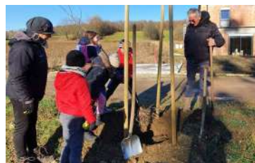
Les écoliers ont planté des arbres