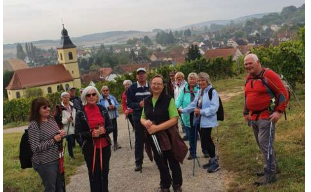
Jeudi 1er octobre : au vignoble de Cleebourg