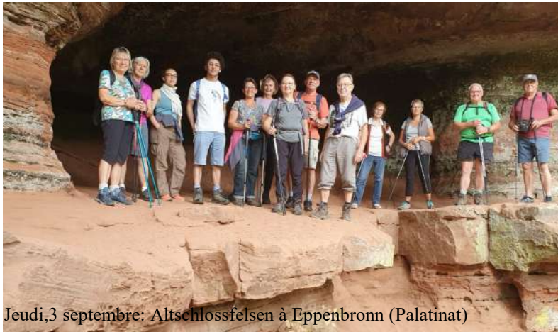
Jeudi, 3 septembre: Altschlossfelsen à Eppenbronn (Palatinat)