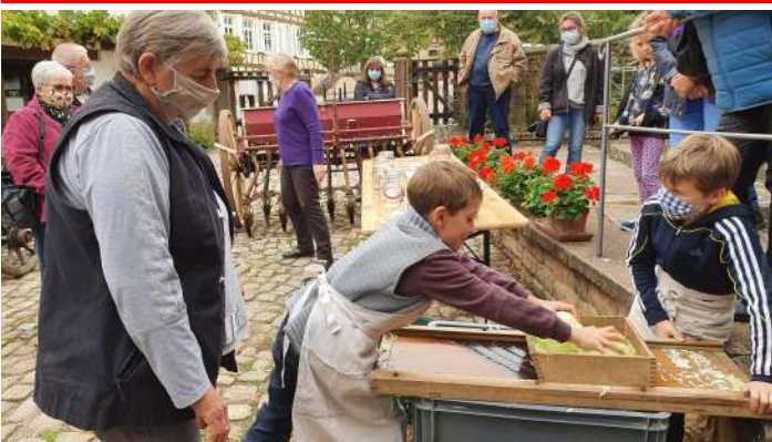
Dimanche 4 octobre : débitage de la choucroute à l'ancienne