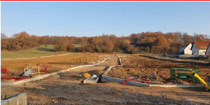
Le lotissement « Les terrasses du Seltzbach » est en chantier (30 novembre 2020)

Le lotissement du Wingertsfeld étant complet, une nouvelle tranche nommée « Les terrasses du Seltzbach » est en train d'être aménagée dans son prolongement vers Oberkutzenhausen.