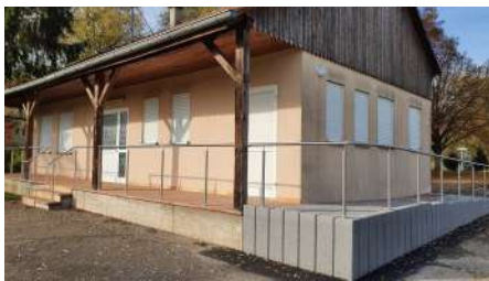
Club-house de l'ancien Tennis-Club