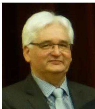
Pierrot Sitter 2è mandat