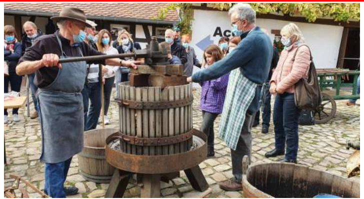
Dimanche 11 octobre : pressurage des pommes à l'ancienne