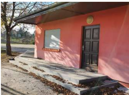
Club-house du Football-Club